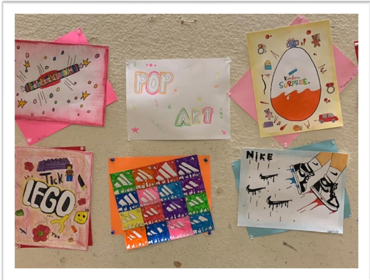
POP ART, 5 e année, Mme Valérie